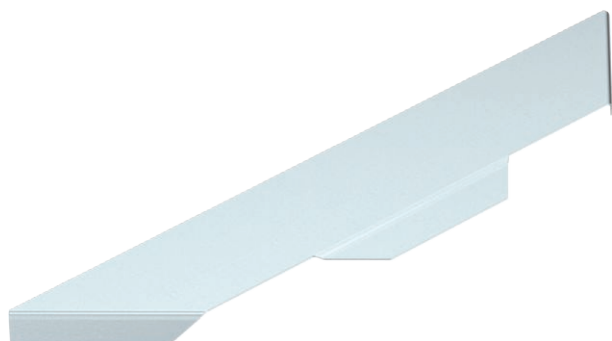
Крышка для Т-образного/крестового соединения