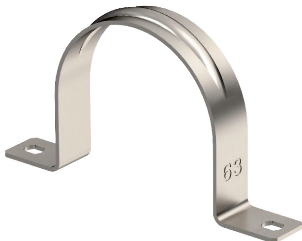
Зажимная скоба для кабеля и труб