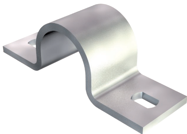
Зажимная скоба с двумя лапками 32 мм