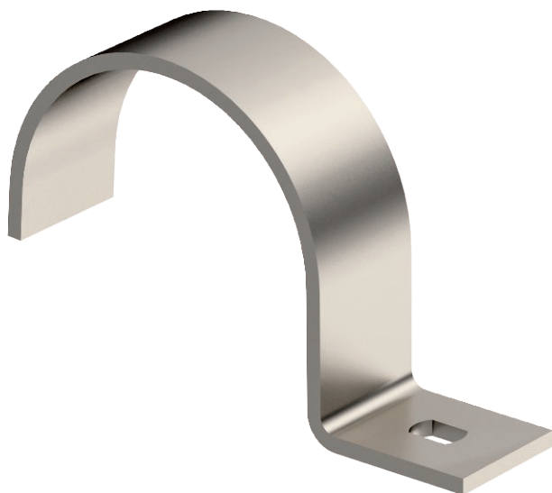
Зажимная скоба с одной лапкой 25 мм